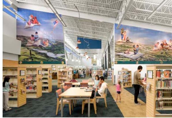
عمل فني في مكتبة وادي كاسترو بالمقاطعة للفنان جوس سانسيز، وهو جزء من مجموعة مقاطعة ألاميدا الفنية.

تمتلك مقاطعة ألاميدا أو تستأجر ما يقرب من 8.7 مليون قدم مربع من المرافق، وتحافظ على البنية التحتية العامة في المناطق غير المدمجة. سيتطلب تحقيق هدفنا المناخي إزالة الكربون من الطاقة المستخدمة عن طريق استبدال الغاز الطبيعي بالمعدات التي تعمل بالطاقة الكهربائية في منشآتنا. وسيؤدي ذلك إلى القضاء على حرق